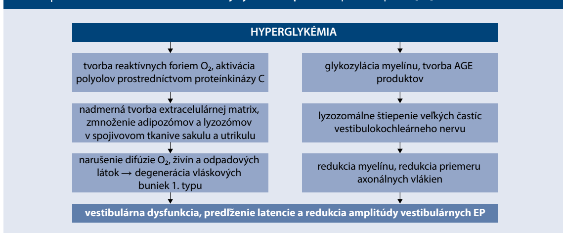
Schéma | Mechanizmus vzniku vestibulárnej dysfunkcie pri DM. Upravené podľa [26]

AGE – neskoré produkty pokročilej glykácie/Advanced Glycation End products EP – evokované potenciály O 2 – kyslík