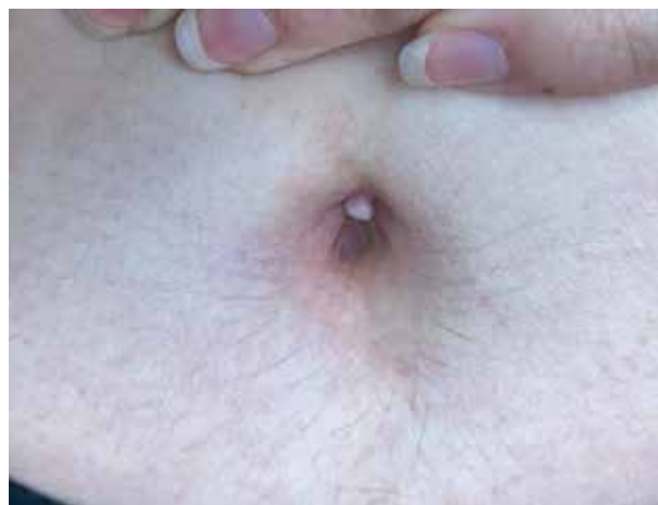
Obr. 1. Klinický obraz

si na dyspareunii. Asi pět let užívala hormonální antikoncepci, nicméně po jejím vysazení si začala stěžovat na bolestivou menstruaci. Při klinickém vyšetření v kožní ambulanci byl zjištěn tuhý, exofyticky rostoucí nodule velikosti asi 10 x 10 mm v oblasti umbiliku, který se jevil palpačně tuhý, měl lehce nafialovělou barvu, ale nekrvácel (obr. 1). Pacientce byl na naše doporučení následně tento útvar excido-