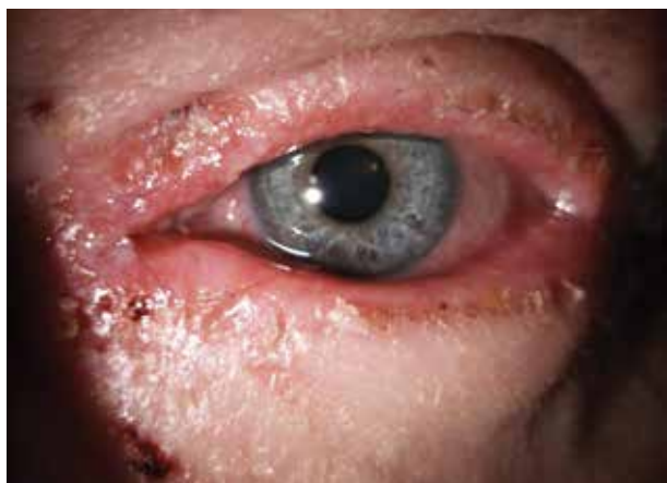
Obr. 2. Těžká atopická blefaritida a ekzém víček

Lékař by měl při nálezů ekzému očních víček u atopika zpozornět, zejména při kombinaci s pruritem a mnutím