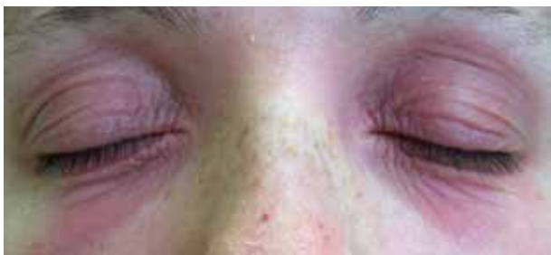
Obr. 1. Atopická dermatitida očních víček a obličeje

V Německu byly v letech 1999–2004 nejčastějším zdrojem relevantních kontaktních alergenů u ekzémů očních víček obličejové krémy, oční stíny, oční kapky a léky (31 %). Nejčastějšími ostatními alergeny s pozitivní reakcí pak byly vonné látky (parfémy mix I a Peru balzám), konzervancia (thiomersal) a léky (neomycin