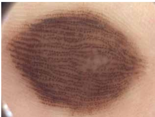
Obr. 6. Kongenitální melanocytový névus „Peas in a pod pattern“ – sulci superficialis jsou lemováni tenkými hnědými liniemi, mezi nimi jsou pigmentové tečky nebo menší globule.