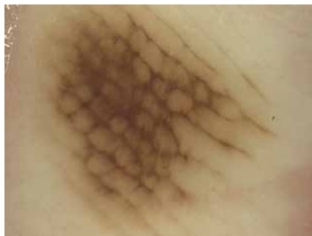
Obr. 4. Melanocytový névus „Lattice like pattern“ – lineární pigmentace ve žlábcích pospojovaná napříč do obrazu mříže.

Především melanocytové névy mohou mít schematicky celou řadu variant. Může jít o typ mřížkovitý („lattice like pattern“), fibrilární, homogenní, globulární, retikulární, atypický a řadu dalších [2, 3]. Typ mřížkovitý (obr. 4) je tvořen tenkými hnědými liniemi v sulci superficiales, které jsou na rozdíl od nejčastější varianty navíc navzájem pospojovány kratšími liniemi probíhajícími napříč. Dermatoskopický obraz tak připomíná mříž. Mřížkovitý typ je druhým nejčastějším nálezem u získaných melanocytových nevů, v praxi se s ním setkáváme velmi často a je ukazatelem nezhoubného charakteru akrální melanocytové léze. Typ fibrilární (obr. 5) je tvořen velmi tenkými hnědými liniemi, které probíhají paralelně šikmo jak přes sulci superficiales, tak i přes cristae superficiales [2, 3]. Setkáváme se s ním při vyšetření melanocytových projevů na chodidlech v místech největší mechanické zátěže, kam je přenášena většina tělesné hmotnosti – tedy nejčastěji na patách a při zevním okraji chodidla. Ke vzniku tohoto vzorce pigmentace dochází díky posunu nejsvrchnějších vrstev epidermis (sešikmení stratum cor-