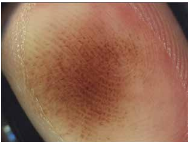
Obr. 8. Intrakorneální hemoragie Parallel-ridge like pattern – rezavě hnědá široká lineární pigmentace nad cristae superficiales. Vzniká po chronické traumatizaci.

Závěrem je možné konstatovat, že dermatoskopické vyšetření hraje u plochých pigmentovaných projevů