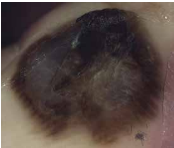
Obr. 7. Maligní melanom 1,1 mm s regresí Projev je větší než 1 cm v průměru, v centru bezstrukturální okrsky s difúzní šedomodrou nebo bělavou pigmentací, při okrajích široká lineární pigmentace nad cristae superficialis.

neum) pod mechanickým vlivem. Fibrilární pigmentace (především pravidelná) odpovídá ve většině případů melanocytovému névu, nevyklučuje ale v ojedinělých případech (nepravidelné uspořádání) tenký maligní melanom (většinou melanoma in situ).