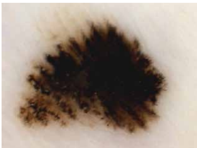
Obr. 2. Melanoma in situ „Parallel ridge pattern“ – paralelně probíhající široká lineární pigmentace nad cristae superficiales, nevidíme akrosyringia.