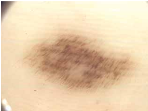
Obr. 5. Melanocytový névus atypický Fibrilární typ – tenké hnědé linie paralelně probíhající šikmo napříč sulci superficialis i cristae superficialis, pravidelné uspořádání.