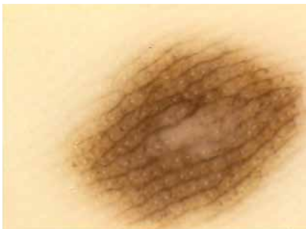
Obr. 1. Melanocytový névus „Parallel furrow pattern“ – paralelně probíhající tenká lineární pigmentace v sulci superficiales, viditelná akrosyringia.