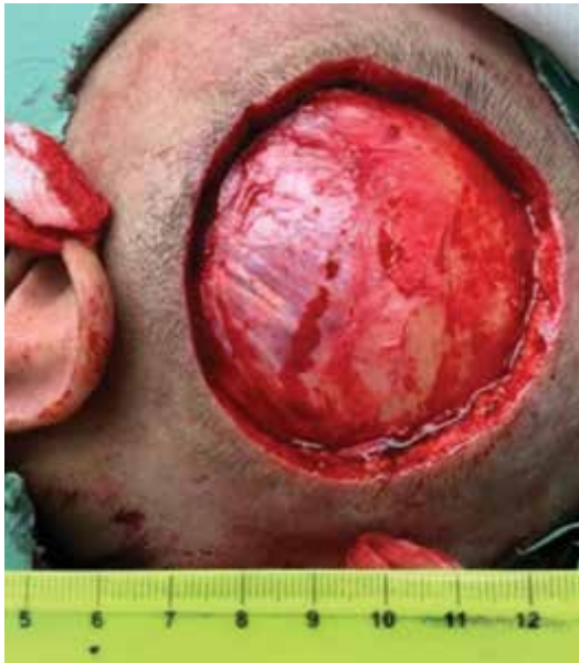
Obr. 4. Po excizi tumoru