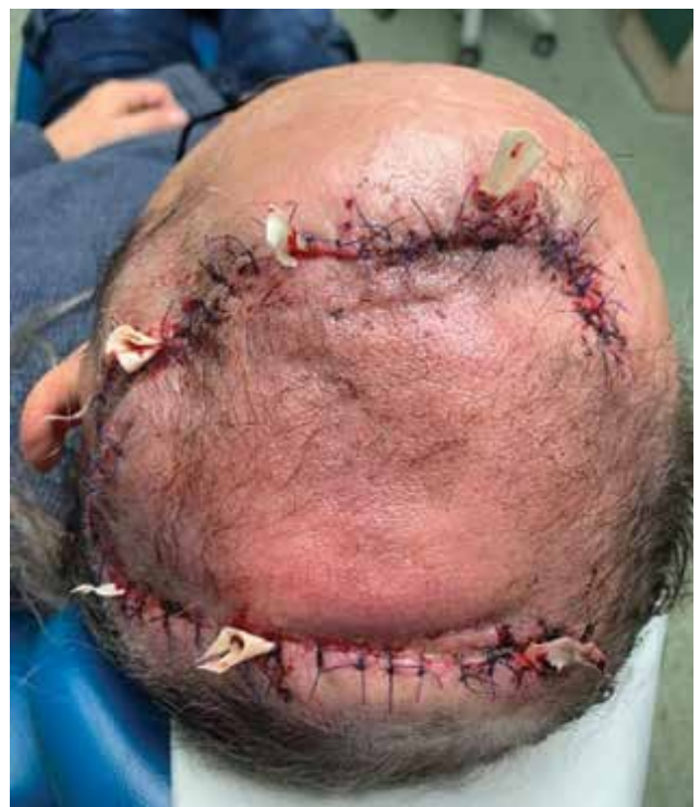
Obr. 8. Plastika defektu