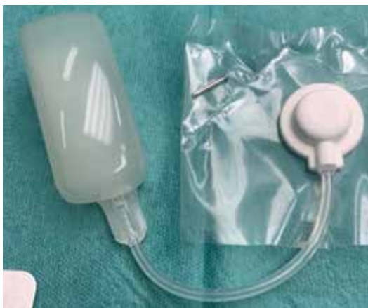
Obr. 5. Tkáňový expandér