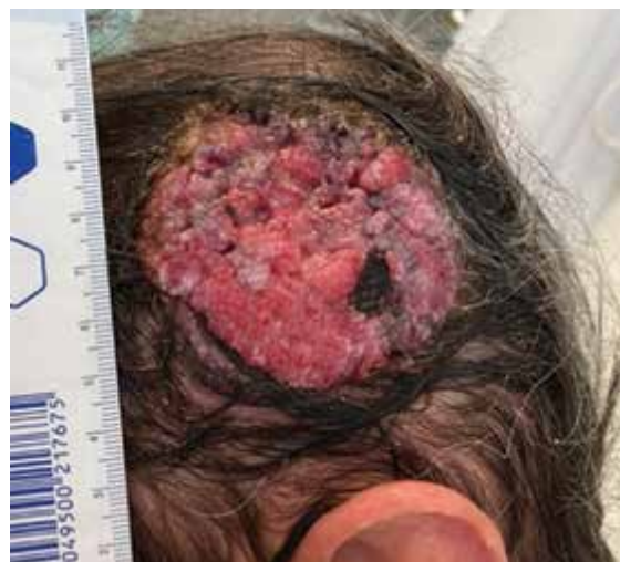
Obr. 1. Tumor parietotemporální oblasti

Při přípravě výkonu jsme z CT vyšetření lebky pacienta zhotovili počítačový 3D model oblasti (obr. 2)