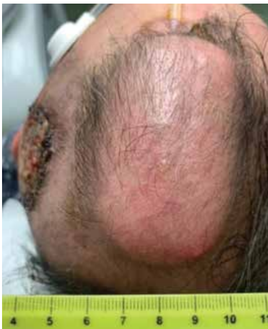
Obr. 6. Tkáňový expandér s portem zevně