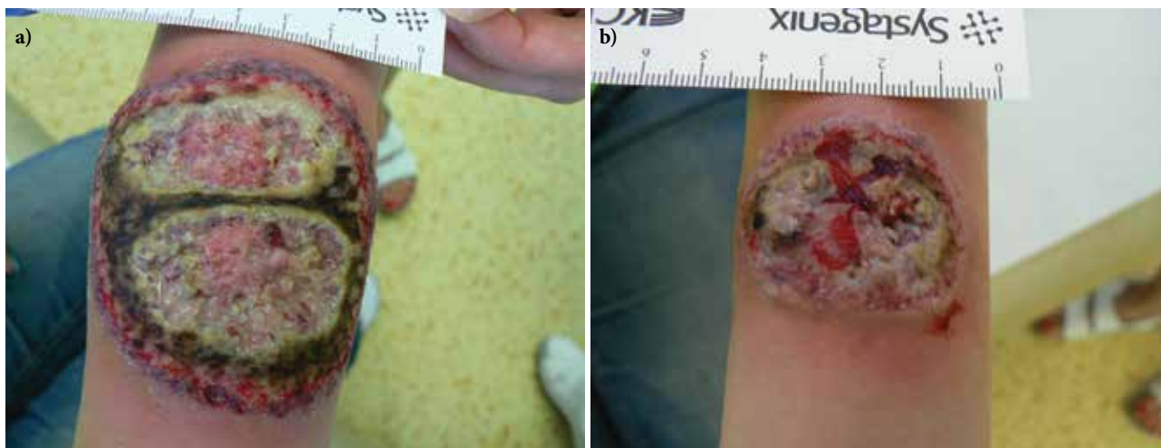
Obr. 1. Vředy při přijetí a – pravé předloktí, b – levé předloktí

rací, kde podle závěru byla popisována akutní neutrofilní nekrotizující dermatóza s perivaskulární lymfoidní proliferací bez patrného aberantního fenotypu. V laboratorních výsledcích se zjistily pouze menší odchylky ve smyslu sideropenické anémie, mírná elevace zánětlivých parametrů, revmatologický screening (ASCA, ANA, ENA, RF, ANCA) vykázal pozitivitu u ANCA atypických protilátek (atypická perinukleární ANCA fluorescence s intranukleárním barvením -p-ANCA [22]), sérologie na lues byla negativní. V dalším průběhu byla doplněna imunofenotypizace z periferní krve i z kožní biopsie, která neprokázala hematologické malignity. Celková terapie kortikosteroidy byla konzultována s gynekologem – v úvodu jsme podali bolusy Solu-Medrolu 125 mg i. m. po 2 dny, s následným přechodem na p. o. formu kortikosteroidů (Prednison à 20 mg tbl.) v úvodní dávce 1 mg/kg/den. Lokálně jsme aplikovali obklady se superoxidovanými roztoky (Aqvitox®, Octenilin®) a zprvu antiseptické krytí (Bactigras®), následně krytí s obsahem oktenidinu a kyseliny hyaluronové (Sorelex®). Pro zlepšování klinického nálezu