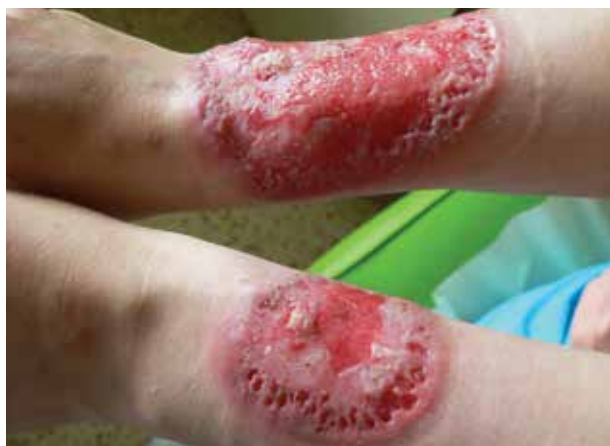
Obr. 2. Stav po 19 dnech hospitalizace

rací, kde podle závěru byla popisována akutní neutrofilní nekrotizující dermatóza s perivaskulární lymfoidní proliferací bez patrného aberantního fenotypu. V laboratorních výsledcích se zjistily pouze menší odchylky ve smyslu sideropenické anémie, mírná elevace zánětlivých parametrů, revmatologický screening (ASCA, ANA, ENA, RF, ANCA) vykázal pozitivitu u ANCA atypických protilátek (atypická perinukleární ANCA fluorescence s intranukleárním barvením -p-ANCA [22]), sérologie na lues byla negativní. V dalším průběhu byla doplněna imunofenotypizace z periferní krve i z kožní biopsie, která neprokázala hematologické malignity. Celková terapie kortikosteroidy byla konzultována s gynekologem – v úvodu jsme podali bolusy Solu-Medrolu 125 mg i. m. po 2 dny, s následným přechodem na p. o. formu kortikosteroidů (Prednison à 20 mg tbl.) v úvodní dávce 1 mg/kg/den. Lokálně jsme aplikovali obklady se superoxidovanými roztoky (Aqvitox®, Octenilin®) a zprvu antiseptické krytí (Bactigras®), následně krytí s obsahem oktenidinu a kyseliny hyaluronové (Sorelex®). Pro zlepšování klinického nálezu