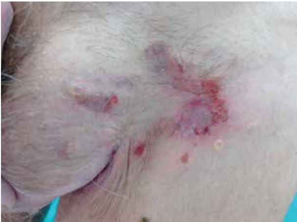
Obr. 1. Eroze s krustami a vezikulami na erytémové spodině