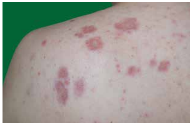
Obr. 3. HE 100krát – nekaseifikující dobře ohraničené „nahé“ sarkoidní granulomy v dermis a subcutis Fotografie publikována se souhlasem Ústavu klinické a molekulární patologie FN Olomouc.