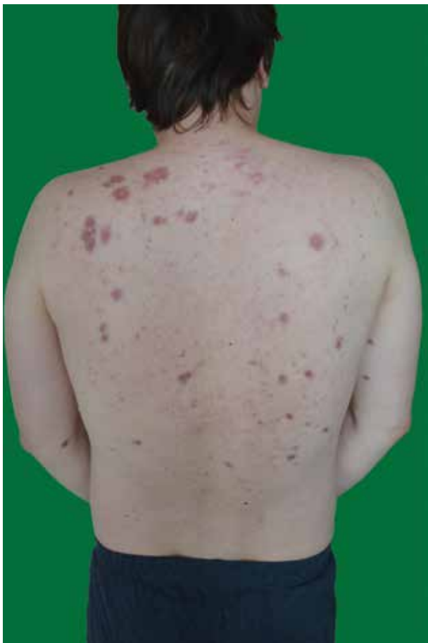
Obr. 1. Mnohočetné uzlovité infiltráty hnědočerveného zbarvení

V květnu 2016 byla cestou pneumologa zahájena systémová kortikoterapie prednisonem v úvodní dávce 40 mg/den s postupnou redukcí dávky při regresi plicního i kožního nálezu. Specifické laboratorní markery klesly do mezí normy. Spirometrické vyšetření prokázalo výrazné zlepšení funkčních hodnot. V srpnu 2017 se podařilo navodit remisi onemocnění a systémová kortikosteroidní léčba byla ukončena. Při kontrolním plicním vyšetření v dubnu 2018 se však laboratorně opětovně objevila výrazná elevace výše uvedených specifických markerů a zhoršení hodnot spirometrického vyšetření. Na rentgenovém snímku hrudníku bylo patrné zvětšení obou plicních hilů. Stejně tak byla potvrzena progresse nálezu CT vyšetřením. Stav byl hodnocen jako první recidiva plicní sarkoidózy. Recidiva kožního postižení se neopakovala.