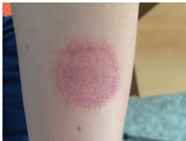
Obr. 3. Tinea corporis na levém předloktí třetího pacienta – červenofialové šupící se ložisko pokryté papulkami

Pacient (chlapec, 12 let) se dostavil k lékaři kvůli rozšiřujícímu se ložisku na levém předloktí. Objektivně bylo zjištěno červenofialové ložisko o velikosti 35 mm šířící se valem do okolí (obr. 3). Ložisko bylo živé, ve středu se šupilo, spíše nesvědilo a bylo pokryto výraznějšími papulkami. Chlapec byl v dětství léčen opakovaně pro ekzém v obličeji, loketních a podkolenních jamkách. Nyní je již delší dobu bez potíží. Rodina doma chovala ježka bělobřichého a babička měla kočku. Na zvířatech nepozorovali žádné klinické známky kožního onemocnění.