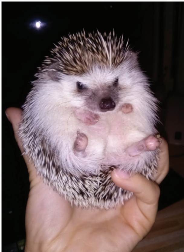
Obr. 4. Ježek bělobřichý ( Atelerix albiventris ) chovaný pacientkou 4