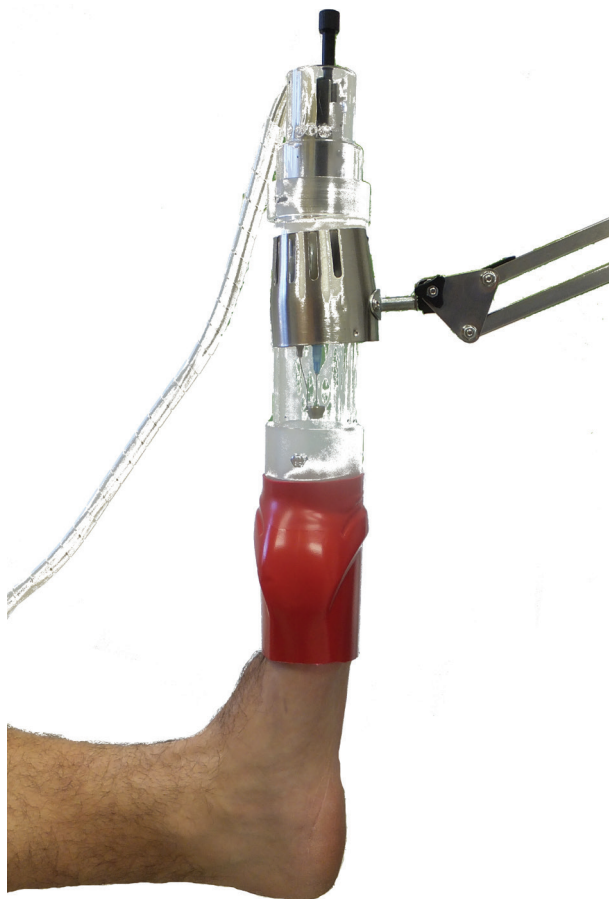
Obr. 2. Fotografie přístroje při expozici postižené končetiny nízkoteplotním plazmatem Zdroj plazmatu, schematicky znázorněný na obrázku 1, je uzavřen v plexisklovém pouzdře a upevněn v teleskopickém držáku. Prsty exponované nohy jsou uzavřeny v plastovém obalu.

benhamiae ) a Nannizzia gypsea byl kompletně inaktivován jen jeden ze tří testovaných kmenů. Podrobněji uvádějí výsledky těchto in vitro studií Soušková et al. [23, 25] a Scholtz et al. [18].