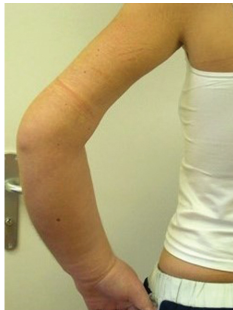
Obr. 4b). Strangulační rýha na levé paži

v souvislosti s jednou z opakovaných hospitalizací na infekčním oddělení, při které byla zachycena výrazná diskrepance v hodnotách tělesné teploty na různých místech těla a velké výkyvy teploty během krátké doby (za hodinu z 39 °C na 36,5 °C). Pacientka byla léčena ambulantně i ústavně na psychiatrii pro poruchy osobnosti a deprese, měla problémy v rodinných vztazích. Na dermatologickém oddělení byla ordinována kompresivní terapie, pacientka byla zvýšeně sledována, zaškrcování se však nepodařilo prokázat. Došlo k rychlé úpravě stavu a propuštění do domácí péče. O tři měsíce později byla pacientka hospitalizována znovu, tentokrát pro otok levé