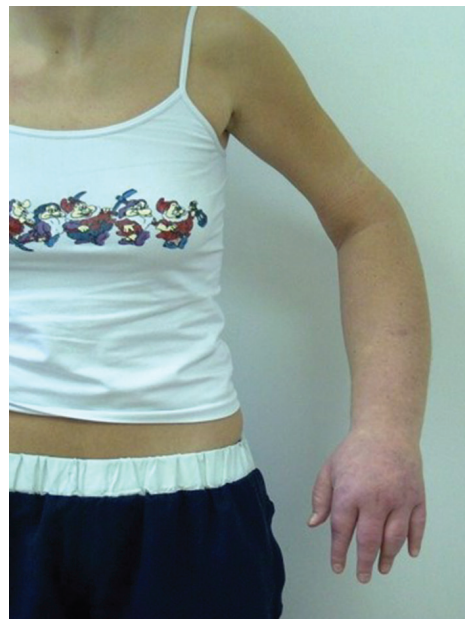
Obr. 4a). Otok levé horní končetiny způsobený jejím zaškracením

Pacientka ve věku 27 let byla odeslána k hospitalizaci na kožní oddělení pro otoky levé dolní končetiny k vyloučení poruchy lymfatické drenáže. V předchozích dvou letech byla opakovaně hospitalizována pro ataky dušnosti, horeček a polymorfní potíže v mnoha nemocnicích po celém kraji. Udávala polyvalentní alergii, užívala čtyři druhy bronchodilancií, dále methylprednisolon, zolpidem (hypnotikum), mirtazapin, escitalopram (antidepresiva) a řadu dalších medikamentů zahrnujících různé doplňky stravy, vazodilatancia, analgetika. V minulosti bylo vysloveno podezření na Münchhausenův syndrom