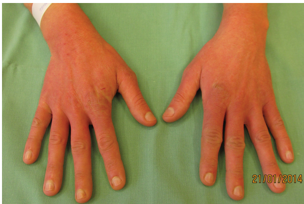
Obr. 3. Rukavicové postižení rukou, erytém až purpurový nádech kůže

noc (antipsychotikum). Pacient nejdříve odmítal hospitalizaci, jako důvod udával strach z nárůzy. Pro tuto obavu si umýval ruce několikrát denně, často myl i další části těla. Objektivně bylo přítomno rukavicové postižení rukou (obr. 3), erytém, lichenifikace a xeróza kůže na hřbetech rukou a dlaních, drobné ragády. Během hospitalizace bylo provedeno psychiatrické vyšetření se závěrem obsedantně-kompulzivní porucha. Výsledky epikutánních testů (Standardní evropská sada) a test alkalirezistence byly negativní. Byla navýšena dávka fluvoxaminu (150 mg/den), lokálně byl léčen steroidními externy a emoliencii. Omezení frekvence mytí rukou bylo za hospitalizace dosaženo krytím obvazy. Pacient byl předán do péče spádového psychiatra, nespolupracoval, neužíval léky podle doporučení, několikrát odmítl hospitalizaci na psychiatrickém oddělení (jedním z udaných důvodů bylo, že musí vyřešit nakaženou oblast konečníku, kterou si několikrát denně drhne kartáčkem, současně došlo ke zhoršení stavu rukou). Po opakovaných intervencích rodiny a psychiatra však nakonec s hospitalizací souhlasil, v nemocnici bylo dohlédnuto na dodržování farmakoterapie a po její úpravě se stav pacienta výrazně zlepšil. V důsledku omezení mytí rukou se zlepšil i kožní nález. V současnosti užívá kombinaci antipsychotik ziprasidonu (20 mg/den), risperidonu (2 mg/den) a antidepresiv clomipraminu (50 mg/den) a sertralínu s postupným snižováním (nyní 50 mg/den).