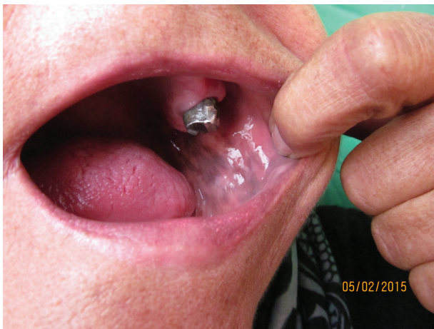
Obr. 1. Postižení sliznice dutiny ústní

i sourozenci a děti. V poslední době nepozorovala změny na kůži či sliznicích, ke stomatologovi chodí na kontroly pravidelně 2krát ročně. Cítí se dobře, sportuje a nemá žádné subjektivní potíže, nemá změnu výkonnosti, nebývá nemocná. Léková anamnéza i po cílených dotazech beze změn. Při důslednější aspekci bylo shledáno bronzové zbarvení celého kožního povrchu s intenzivnějším hnědým nádechem v solárních predilekcích a v oblastech nad kolena, lokty, v kožních záhybech a v papilárních liniích dlaní. Nehty, nehtová lůžka a jizvy byly bez patologického nálezu (obr. 3, 4).