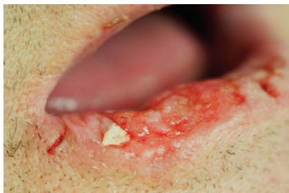
Obr. 2. Erozivní forma spinocelulárního karcinomu dolního rtu (T2) indikovaného ke kvadratické excizi