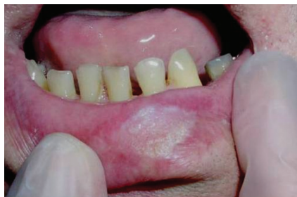
Obr. 1. Spinocelulární karcinom dolního rtu (T1) připomínající hyperkeratózu dolního rtu

Prognóza SCK rtu je relativně dobrá díky jeho viditelnosti a včasnému záchytu (pacientovi léze kosmeticky vadí, proto spíše vyhledá lékaře). Velká většina nádorů je zachycena ve fázi T1N0M0 nebo T2N0M0. Pětileté relativní přežití (tedy po vztažení přežívání pacientů s SCK na přežívání srovnatelné skupiny bez diagnózy SCK) pro tyto časné fáze se v literatuře udává v intervalu 85–99 % [16, 31, 35, 38]. Metastázy na krku se u pacientů s SCK dolního rtu objevují podle různých studií ve 3–29 % případů [16, 26, 36] a v případě jejich výskytu je prognóza výrazně horší – pětileté přežití se udává jen v 25–50 % [1, 36, 41]. Výskyt metastáz souvisí především s velikostí a tloušťkou primárního tumoru a stupněm diferenciací (dobře diferencované nádory mají menší množství metastáz než nediferencované). Častější výskyt metastáz je spojen s rekurentními nádory [16, 26, 41]. Jako hranice, za kterou je již vznik krčních metastáz velmi pravděpodobný, se udává tloušťka nádoru 5 mm [30], případně velikost nádoru 3 cm [41]. Některé studie však detekovaly