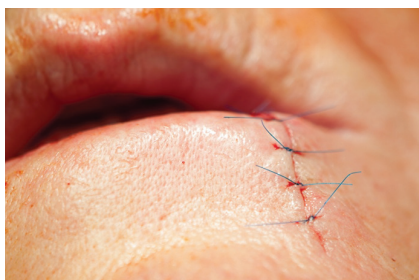
Obr. 8. Sutura rány po klínovité excizi dolního rtu