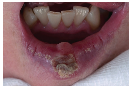
Obr. 3. Ulcerózní spinocelulární karcinom dolního rtu krytý krustou (T1), indikovaný svou velikostí ke klínovité excizi