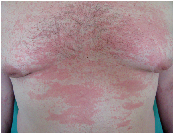
Obr. 4. Exantém při Stillově nemoci

z lymfocytů, histiocytů a neutrofilů, při imunofluorescenci IgM uložení v papilách koria a podél bazální membrány (obr. 3).