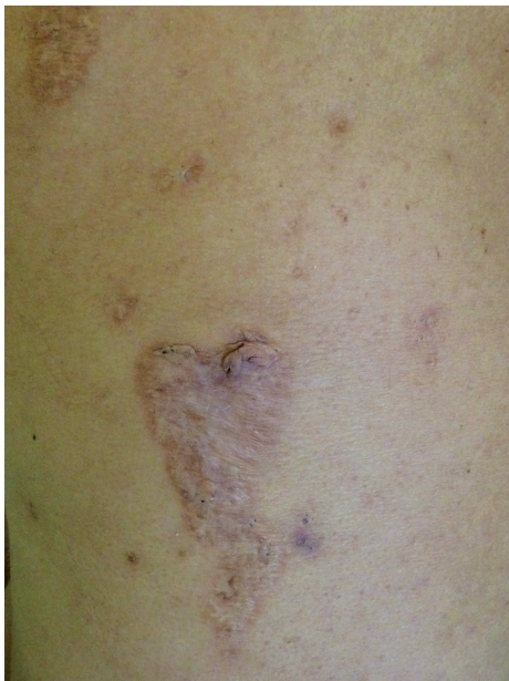
Obr. 5. Kribriformní jizvy po zhojeném pyoderma gangrenosum u pacientky s PASH

(obr. 5). Léčba zahrnuje kortikosteroidy (15–60 mg/den), anti-TNF biologika (infliximab, etanercept), zkouší se i anakinra, cyklosporin, thalidomid [9, 13].