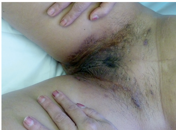
Obr. 6. Hidrosadenitis suppurativa v tříslích u téže pacientky

Tento autoinflamatorní syndrom patří mezi zcela nově popsané autoinflamatorní onemocnění, a to v roce 2012 Braun-Falcm, jr. Liší se od PAPA syndromu absencí epizod pyogenní artritidy. Pacienti mají acne conglobata a hidrosadenitis suppurativa , v těchto lokalitách může následně vzniknout pyoderma gangrenosum [3] – obr. 6, 7. Tyto syndromy se mohou různě sdružovat s dalšími nemocemi, takže se hovoří už o dalších nových akronymech: PAPASH (PASH a pyogenní arthritis), PsAPASH (psoriatická artritida a PASH) [Růžička T.: Autoinflama-