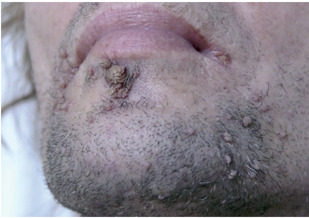
Obr. 1. Verrucae vulgares u HIV pozitivného pacienta na brade a v periorálnej oblasti

Pacient je monitorovaný pre HIV infekciu a v súčasnosti liečený trojkombináciou spomínaných anti-HIV liekov, ktorú užíval aj počas lokálnej liečby HPV infekcie 5% imiquimodom. Lokálna terapia imiquimodom sa aplikovala cielene na prejavy 3x týždenne počas 1 mesiaca. Postupne došlo k deštrukcii patologických lézií iba s miernou lokálnou reakciou v podobe erytému. Iné lokálne ani celkové vedľajšie účinky neboli zaznamenané. Počas ročného sledovania je pacient bez prejavov HPV infekcie.