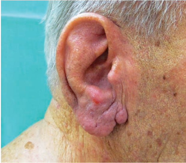
Obr. 1. Klinický obraz