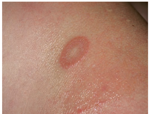
Obr. 2. Granuloma anulare – anulárního ložisko