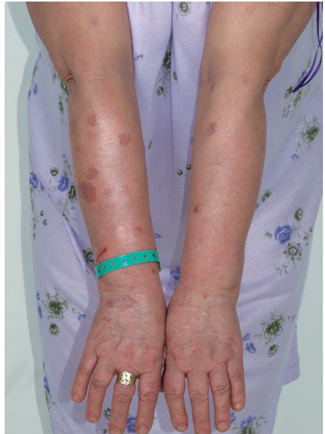
Obr. 1. Granuloma anulare – mnohačetná anulární ložiska

ních i dolních končetinách, v 5 % jen na trupu a přibližně v 5 % ve všech lokalitách. Na obličejí jsou projevy zřídka. Ložiska jsou barvy kůže, růžová, nebo fialová, okraj ložisek je složený z jednotlivých drobných, několikamilimetrových papul, v centru obloukovitých až anulárních ložisek je intaktní kůže (obr. 2). Anulární ložisko má zpravidla průměr několika centimetrů. Solitární papuly s centrální depresí v úrovni kůže (papulárně-umbilikální forma) nebo noduly se nejčastěji vyskytují na prstech. Lokalizovaná forma GA se objevuje nejčastěji u pacientů do 30 let věku, 2krát častěji u žen [2].