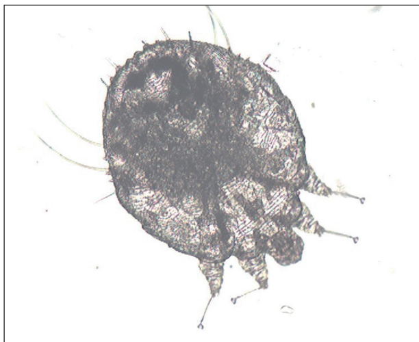
Obr. 5. Mikroskopický nález Sarcoptes scabiei (Danilla T.)

Mikroskopické vyšetrenie z líca aj z hlavy, z nánosov šupín z dlaní aj stupají preukázalo prítomnosť dospelých samičiek a vývojových štádií Sarcoptes scabiei (obr. 4, 5). U matky bolo mikroskopické vyšetrenie tiež pozitívne.