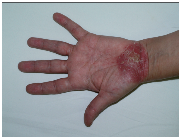
Obr. 2. Psoriatické ložisko na dlani při léčbě etanerceptem.

Paradoxním nežádoucím účinkem léčby je vznik psoriázy při léčení antagonisty TNF \alpha , a to především při terapii revmatoidní artritidy, ankylozující spondylitidy a jiných spondylartritid, Behçetovy nemoci a střevních zánětlivých nemocí. Nejčastěji se objevuje pustulózní psoriáza na dlaních a ploskách (obr. 2). Mechanismus vzniku není znám, ale předpokládá se účast plazmocytoidních dendritických buněk a jejich zvýšená tvorba interferonu \alpha (5). Při podezření na vznik psoriázy během léčby je třeba pátrat po možné vyvolávající příčině (virové či bakteriální infekci, předchozí traumatizaci) a odeslat pacienta k dermatologovi k potvrzení diagnózy klinicky a histologicky. Nemocní většinou mohou pokračovat v léčbě jinými antagonisty TNF \alpha . Profylaktická opatření proti vzniku těchto kožních reakcí zatím nejsou známa. Lokálně se doporučují silně účinné kortikosteroidy, ale i jiná antipsoriatika, při neúspěchu celková terapie stejně jako při závažné psoriáze.