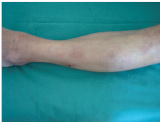
Obr. 1. Metastatická varianta Crohnovy choroby klinického obrazu erythema nodosum.