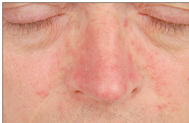
Obr. 2. Papulopustulózní rozacea.

Představuje klasický typ rozacey. Je charakterizována perzistentním centropaciálním erytémem a současně přítomností papul a pustul , které jsou rovněž lokalizovány centropaciálně (43) (obr. 2). Zánětlivé projevy opět vynechávají periorbitální oblast, což je velmi typickým znakem. Subjektivně se může objevit pálení. Na rozdíl od erytematotelangiektatického typu nemají zevní faktory tak velký význam v iritaci kůže. Mírně může být přítomen flushing a teleangiektázie. V důsledku zánětlivých změn někdy vzniká v obličeji chronický edém, který je u některých mužů kombinován s fymatózními změnami.