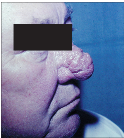
Obr. 4. Rhinophyma.

ní, řezání, svědění, nesnášenlivost světla. Dále může být přítomna hyperémie spojivek, blefaritida, konjunktivitida, teleangiektazie a nepravidelnost okrajů očních víček (3, 43). U některých pacientů může dojít k poruchám vizu následkem postižení rohovky (keratitis). Často se objevuje chalazion nebo hordeolum (43). Oční postižení může předcházet kožní změny řadu let – dle některých studií zhruba u 20 % pacientů s okulární rozaceou se objevuje oční postižení před kožní manifestací (43). Asi u poloviny pacientů jsou nejprve přítomny kožní změny a teprve potom dochází k očnímu postižení (43). Proto by každý pacient s kožními projevy rozacey měl být vyšetřen oftalmologem. Oční rozacea bývá často poddiagnostikována a je léčena pod jinými diagnózami, často nevhodnými antibiotiky.