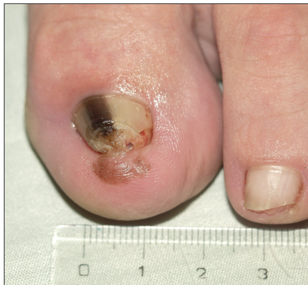
Obr. 4. Akrolentiginózní melanoma in situ , Hutchinsonovo znamení.

lunuly nacházíme v nehtovém lůžku (23). Následkem jsou hnědočervené až černé dyskolorace. Bývají oválné, ale mohou vznikat i třískovité hemoragie nebo lineární pruhy. V odborné literatuře je popsána řada obdobných stavů, pojmenovaných vždy podle příslušného sportu (angl. „ jogger's toenail , skier's toe , tenis toe , golfer's nails “ a další) (1, 3, 18, 23, 25, 28). Diferenciální diagnostika může působit obtíže především při podezření na akrolentiginózní variantu maligního melanomu. K upřesnění diagnózy slouží dermatoskopie či biopsie. K podezření na maligní melanom vede přesah dyskolorace do periunguální oblasti (Hutchinsonovo znamení) a nepravidelné zbarvení léze (15, 23) (obr. 4). Při akutním subunguálním hematomu připadá v úvahu drenáž, při déle trvající bolestivosti je nutné vyloučit postižení skeletu (23, 28). Hojení těchto nálezů je spontánní, ale je limitováno rychlostí růstu nehtové ploténky a může tak trvat 12 až 18 měsíců (10). Časem dochází k absorpci hematomu v lůžku a případná dyskolorace ploténky následně odrůstá spolu s nehtem (28). V prevenci se uplatňují vhodně přiléhající obuv a zastřížení nehtu mírně za laterální okraj prstu a spíše rovně. Nákup sportovní obuvi je doporučován spíše odpoledne a po sportu, kdy noha mírně sesedá (10).