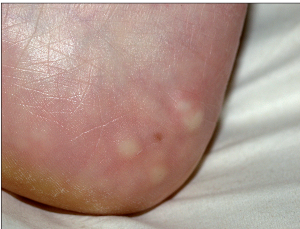
Obr. 2. Piezogení papuly na patě.