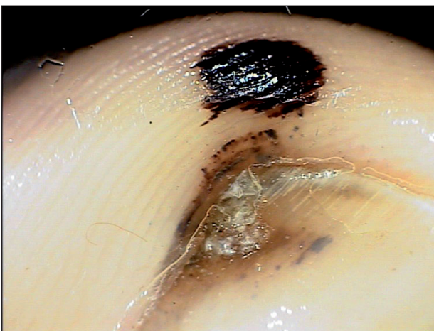
Obr. 3. Nehet sportovců, dermatoskopický obraz.

Především při sportovních aktivitách, které vedou k rychlému brzdění, jako je tenis, basketbal nebo fotbal, je poškozována nehtová ploténka. Dochází ke vzniku souboru změn nehtů nohou i rukou, spočívajících v podnehtových hematomech a hyperkeratózách, někdy onycholýze až onychodystrofii (obr. 3). Příčinou vzniku potíží je narážení nehtu frontálně i dorzálně v příliš úzkém prostoru v obuvi nebo poranění sportovním náčiním (10, 15, 23, 25, 30). Takto poškozený nehet je náchylnější k mykotické infekci. Nález může být oboustranný, ale i jednostranný. Postižen bývá nejdálší prst, ale místo vzniku závisí i na konkrétním sportu a mechanismu traumatizace. Změny u prvního a druhého prstu pozorujeme u tenistů, fotbalistů, lyžařů a dalších (3, 6, 10, 18, 23, 28, 30). U běžců je popisováno postižení třetího až pátého prstu, ale není vzácný ani nález na prvních dvou prstech (1, 3). Uvedené změny se vyskytují spíše v distální části nehtu (15).