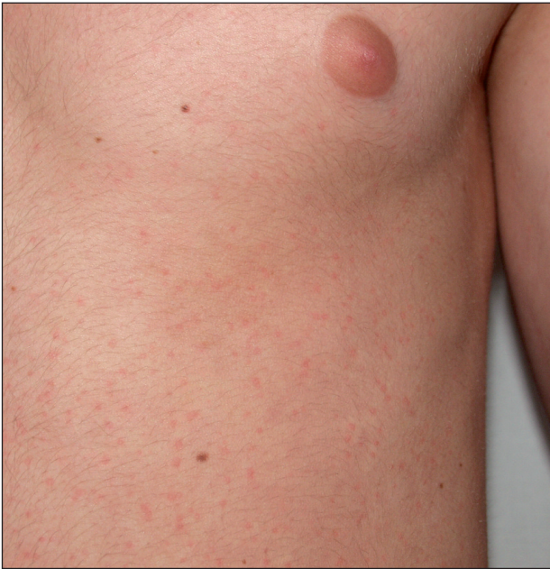
Obr. 11. Cholinergní kopřivka.