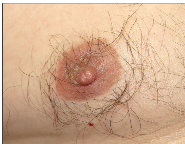
Obr. 6. Poranění bradavek při sportu, Nordic walking.

Třením s oděvem dochází ke vzniku bolestivých erozí a iritační dermatitidy na bradavce i areole (obr. 6). K jejich vzniku přispívají hrubá vlákna oděvu a chlad, kdy jsou prsní bradavky vzpřímené (23, 25, 28).