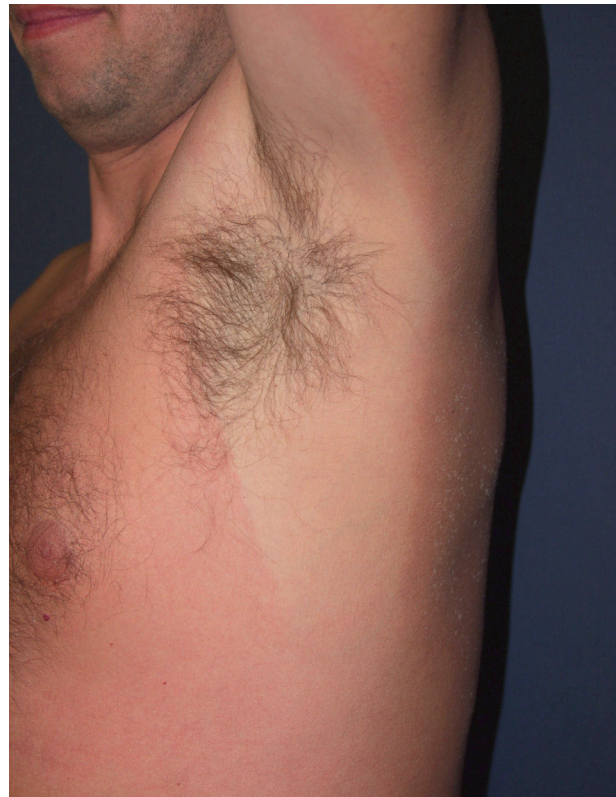
Obr. 8. Erythema solare.

Řada sportovců podceňuje účinnou fotoprotekci. Opakované spálení sluncem (obr. 8) podobně jako i kumulativní UV dávka zvyšují riziko melanocytových i nemelanocytových kožních nádorů. Riziku jsou vystaveni např. cyklisté, běžci, tenisté, veslaři a další. Expozice UV u lyžařů je zvýšena odrazem záření od sněhu a jeho celkově vyšším množstvím vzhledem k menší tloušťce atmosféry ve vyšších nadmořských výškách (18, 24, 25, 28). Zvýšená opatrnost je na místě v případech užívání léků s rizikem fototoxické reakce (tetracykliny, hydrochlorothiazid, amiodaron a další) (10, 24, 30).