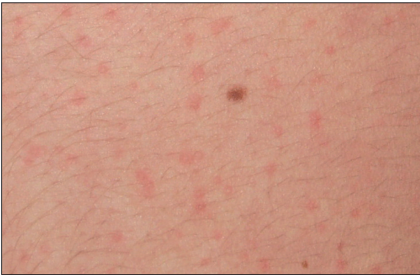
Obr. 12. Cholinergní kopřivka, detail.

a hrudník, ale může se šířit na končetiny i generalizovat (obr. 11, 12). Cholinergní kopřivka může být doprovázena celkovými příznaky, podobně jako jiné urtikárie. V léčbě se doporučuje profylaktické podání antihistaminik před expozicí vyvolávajícím faktorům (6, 23, 28). Prevencí je eliminace zjištěných příčin (28).