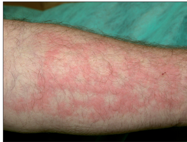
Obr. 13. Chladová kopřivka.

Solární kopřivka se objevuje několik minut po vystavení kůže slunci nebo umělým světelným zdrojům. Ustupuje většinou do hodiny po ukončení expozice (4, 24, 28, 30). Počátečním příznakem je svědění, následované erytémem a urtikariálním výsevem. Častěji než na opakovaně exponovaných oblastech (obličej, ruce) dochází k výsevu na místech méně často vystavených záření (trup). V léčbě první linie jsou doporučována antihistaminika, jako druhá linie pak desenzitizační fototerapie, případně PUVA (5). Pokud akční spektrum leží v UV oblasti, je prevencí účinná fotoprotekce, a to externí nebo