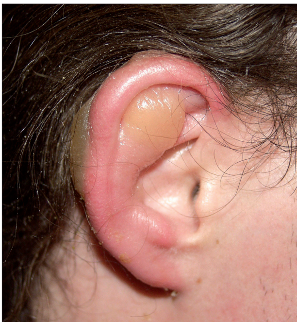
Obr. 7. Omrzliny boltce 2. stupně.

Léčba omrzlin byla v posledních letech přehodnocena. V současnosti se doporučuje rychlé zahřátí ve vodní lázni o teplotě kolem 40 °C po dobu 20 minut (podle různých autorů od 38–44 °C) (3, 4, 23, 28). Pokud již byla postižená oblast takto ošetřena, je velice důležité zabránit jejímu opakovanému prochlazení (např. při převozu), které by mělo mnohem závažnější následky než původní omrznutí (28). Nově se doporučuje heparinizace k usnadnění prokrvení v trombotizovaných periferních cévách. Účinný by měl být také pentoxifylin a protizánětlivé látky celkově (nesteroidní antiflogistika, podle některých studií methylprednisolon) (4). Také by měla následovat profylaxe tetanu.