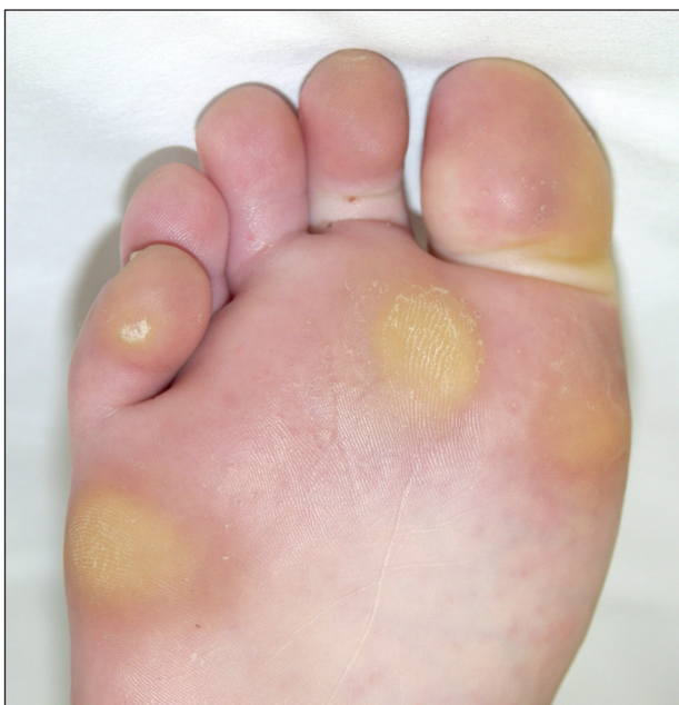
Obr. 1. Mozoly na chodidle a palci, vulgární veruka na 5. prstu.

Mozol vzniká jako adaptační změna v kůži při opakovaném tření nebo tlaku, a to často také v místech dřívějších traumatických puchýřů (6, 18, 25, 28, 30). Jde o tlakovou hyperkeratózu. U sportovců, stejně jako v běžné populaci, jsou nejčastěji postiženy ruce