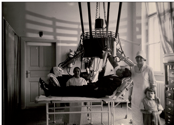
Obr. 4. Světloléčba.

Intenzivní vědecká práce a výměna nabytých poznatků