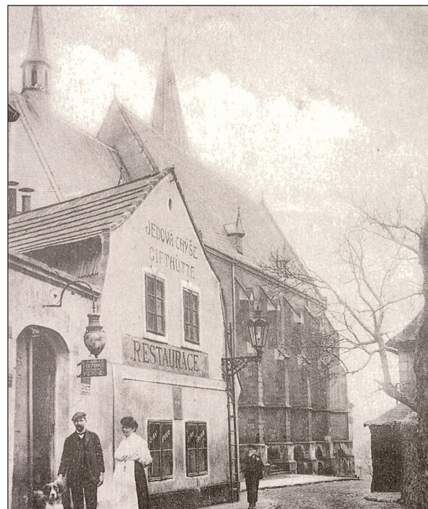
Obr. 2. Jedová chýše.

Janovský ovládal kromě češtiny a němčiny i angličtinu, francouzštinu a italštinu. Měl tak v dosahu zdroje poznání z celého kulturního světa, a ty užíval při svých výkladech studentům. V žádné klinické přednášce neslyšeli studenti citovat tolik světových lékařských autorit jako u Janovského. Nikdy se také neopomenul zmínit o „svém příteli Unnovi“. Nejlepším zrcadlem vylíčeného obrazu