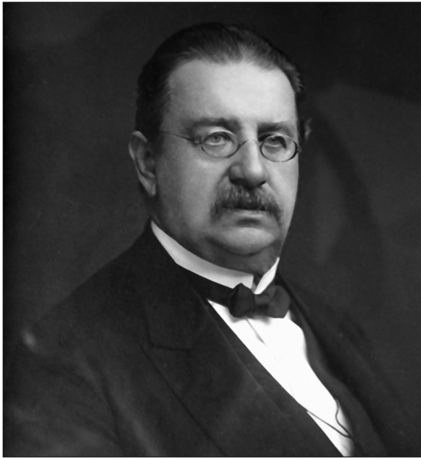
Obr. 1. Prof. Vítězslav Janovský.

nemocí a vedle toho suploval od roku 1874 na I. chirurgické klinice za profesora Blažinu. Byl tedy vytížen vedením více pracovišť a sotva se tak mohl věnovat vědecké práci. Existuje ale také domněnka, podle které Weiss vedl kožní oddělení s úmyslem, že je předá ve vhodné době některému schopnému českému lékaři, kterého nakonec viděl ve Vítězslavu Janovském.