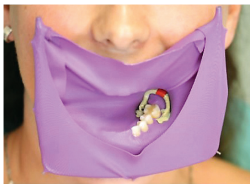
Obr. 1 Kofferdam aplikovaný do dutiny ústní

Další systémy zajišťující absolutní izolaci operačního pole jsou například OptiDam (Kerr Hawe SA, Švýcarsko) a OptraDam plus (Ivoclar Vivadent, Lichtenštejnsko). OptiDam využívá plastový rámeček modifikovaný podle tvaru obličeje pacienta ( obr. 2 ). OptraDam plus se skládá z gumové blány s vyznačenými mís-