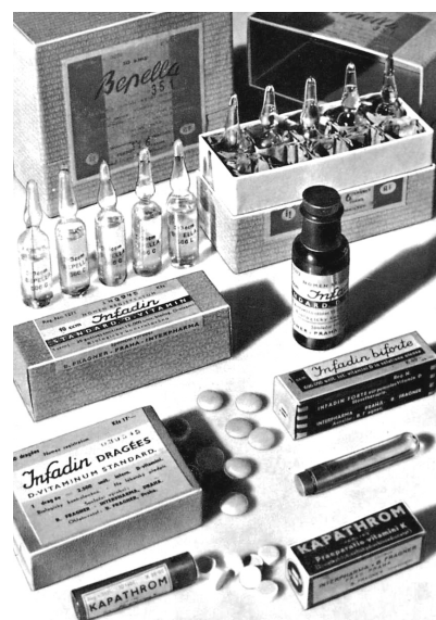
Obr. 4. Infadin

„Vitamins. Nástin významu a terapeutického upotřebení vitaminů v lékařské praxi“, která vyšla v roce 1939. Další knihou, kterou vydala firma Interpharma, je publikace „Hormony ženského cyklu „Interpharma“. Obě knihy sloužily jako pozornosti pro lékaře, jsou dostupné v archivu Českého farmaceutického muzea v Kuksu.