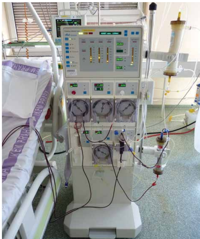
Obrázek 1. Aferetický přístroj nasetovaný na rheoferézu. Dole membránový filtr oddělující plazmu od krevních elementů, nahoře rheoferetický filtr vychytávající makromolekuly. K posteli přichyceny setové linky mimotělního oběhu odvádějící z pacienta a vracející plnou krev zpět do oběhu pacienta

ronektinu [2]. Dochází ke snížení aktivity všech tří drah komplementu. To vede ke zlepšení viskozity krve a plazmy, ke snížení agregace erytrocytů. Nezávisle na základní chorobě dochází ke zlepšení mikrocirkulace. Fibrinogen a další globuliny, jako např. \alpha_2 -makroglobulin, jsou determinantami krevní viskozity a slouží jako makromolekulár-