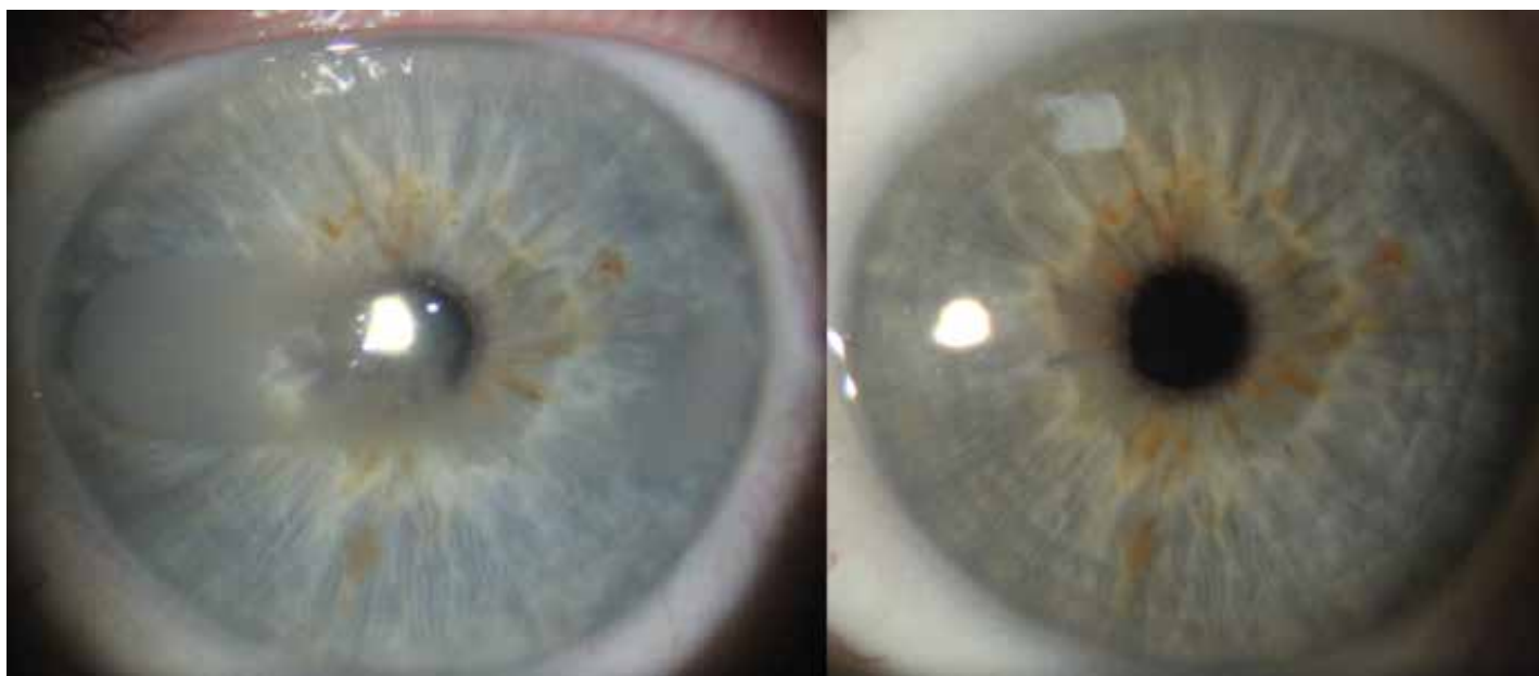
Obrázek 2. Vlevo předoperační nález pacienta č. 1, vpravo kompletní remise – 3 roky po operaci

U všech žen se jednalo o unilaterální onemocnění. U jediného muže bylo postižení oboustranné, nicméně léčeno bylo pouze symptomatické levé (nedominantní) oko. Bilaterální poškození rohovky u tohoto nemocného bylo zřejmě v souvislosti s dlouhodobou lokální aplikací anti-