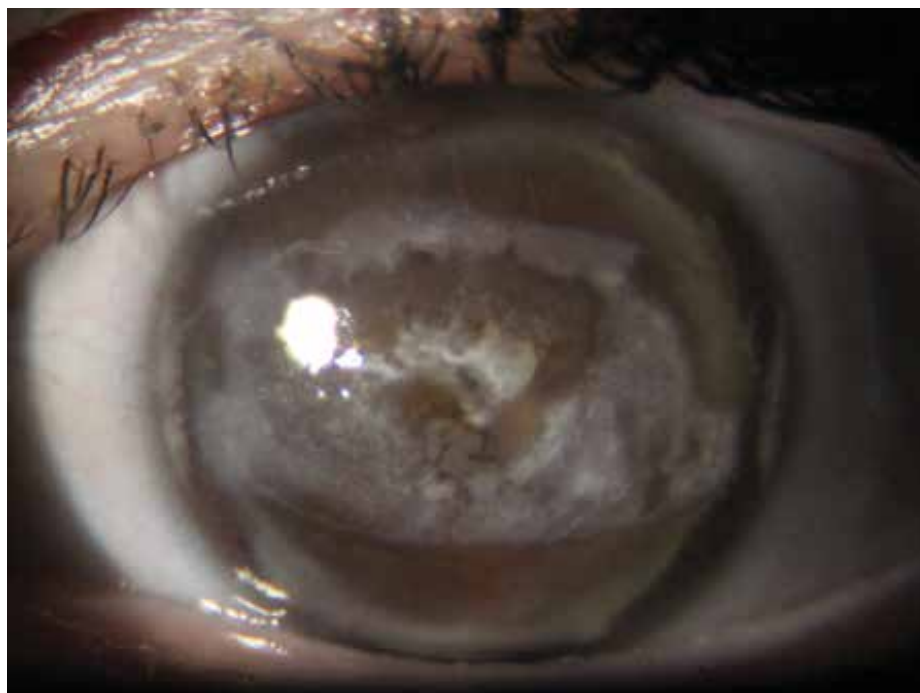
Obrázek 1. Zonulární keratopatie pacientky č. 4

Retrospektivně byly vyhodnoceny dlouhodobé výsledky terapie pacientů se zonulární keratopatií, kteří byli lé-