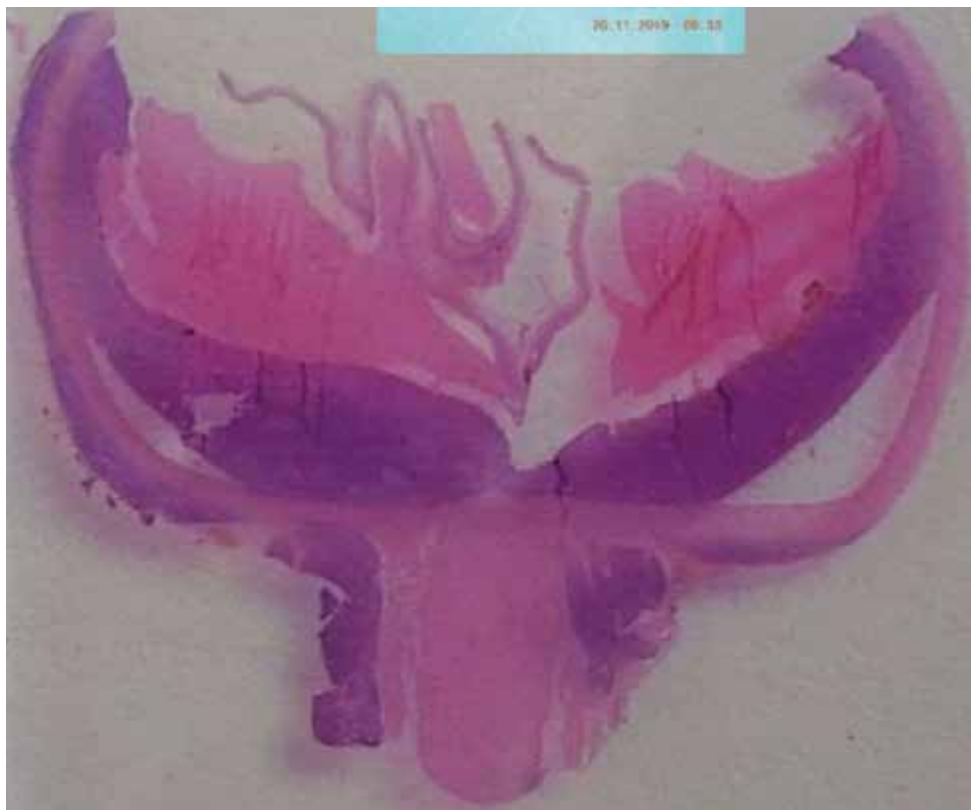
Obrázok 3.: Histologický nález: tumor na zadnej stene bulbu pod cievkou a retrobulbárna infiltrácia okolo zrakového nervu

infiltrácia malými lymfocytmi s jadrom okrúhlym alebo s mierne poprehýbanou jadrovou membránou, hrudkovitým chromatínom, centrálnym jadričkom, malým množstvom cytoplazmy, s tvorbou zárodočných / proliferačných centier, mitotická aktivita je nízka. Rovnaká infiltrácia bola aj v retrobulbárnom tkanive po stranách zrakového nervu.