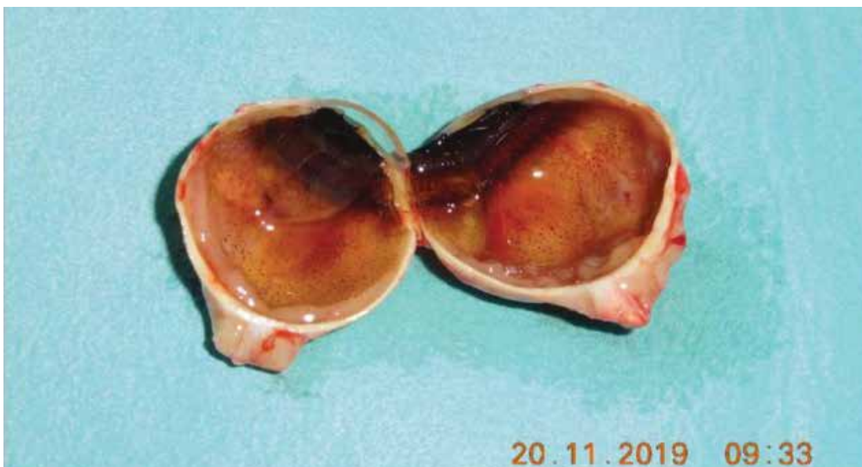
Obrázok 2.: Bulbus po enukleácii: intrabulbárna masa 2x1 cm s cirkulárnym prerastaním okolo zrakového nervu

teľná amočná odozva vo všetkých kvadrantoch, odlúčenie choroidey, terč zrakového nervu prekrytý tumorom, rozšírenie zrakového nervu a negatívne echo v hrúbke 5mm. Magnetická rezonancia preukázala nepravidelné zhrubnutie steny ľavého bulbu, obraz plošného zhrubnutia choroidey do hrúbky 2,8 mm, prítomné retrobulbárne šírenie v okolí terča zrakového nervu a iniciálneho úseku zrakového nervu s rozmermi 14x5,5 mm a obraz plošnej amócie sietnice. Mozgový parenchým bol na magnetickej rezonancii intaktný. Vyšetrenie optickou koherentnou tomografiou nebolo možné zrealizovať, pacientka nefixovala ľavým okom. Fluoresceínová angiografia nebola realizovaná pre jednoznačný nález tumorózneho intraokulárneho ložiska s postihnutím iniciálneho úseku zrakového nervu na ultrasonografii