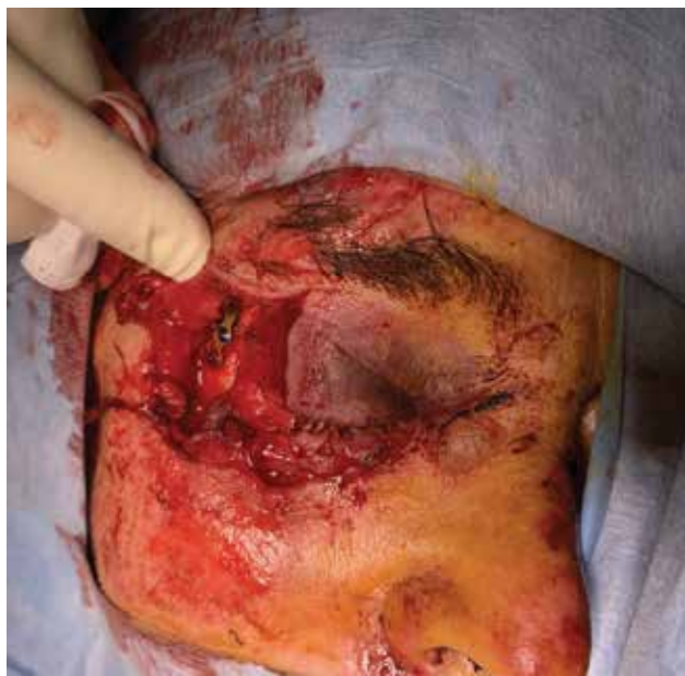
Obrázek 6-a. Těžké poranění očnice a víček při autonehodě. Je patrná již provedená rekonstrukce zlomeniny vnější stěny očnice stomatochirurgem

U všech traumat bychom měli ověřit, zda má pacient platné očkování proti tetanu a zda je rekonstrukci možné provést v lokální anestezii. Obecně ale platí, že pro rozsáhlá poranění víček, poranění slzných cest,