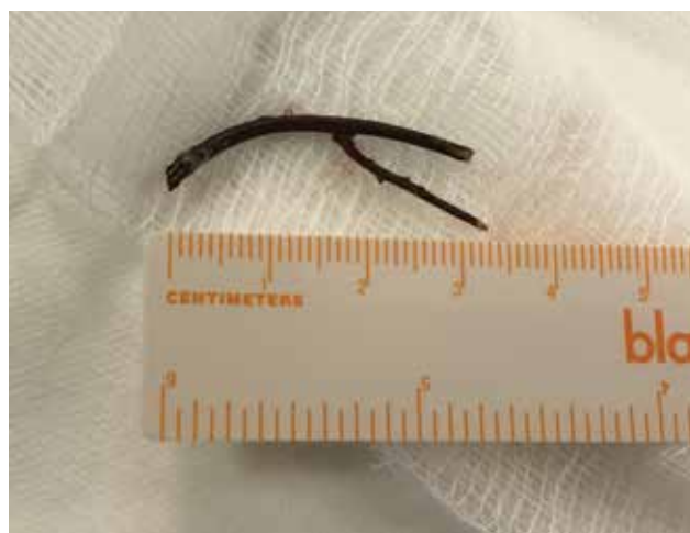
Obrázek 4-b. Extrahovaná větvička z přední části očnice

U kontuzí očnice je nutné pamatovat, že dle některých prací až 29,4 % může být spojeno s blow-out zlomeninou očnice [17]. Proto by tyto pacienti měli být důsledně vyšetřeni včetně zobrazovací metody.