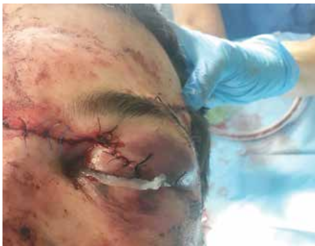
Obrázek 5-b. Stav bezprostředně po rekonstrukci víčka oftalmologem

[19]. Role MR je i důležitá v diagnostice traumatické neuropatie optického nervu.