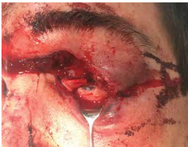
Obrázek 5-a. Profesionální poranění pilou. Rána na horním víčku je natolik hluboká, že došlo k poškození musculus levator palpebrae superioris

V případě orbitálního poranění pak vždy doplňujeme zobrazovací metodu, primárně CT [19]. CT vyšetření nám navíc může pomoci při nepřehledném nálezu vyloučit poranění očního bulbu – jeho sensitivita je v tomto případě kolem 75 % [20]. Navíc má nezastupitelnou úlohu při identifikaci cizího tělesa v očnici. Jedině pokud je definitivně cizí kovové těleso očnice či bulbu vyloučeno, můžeme přistoupit k vyšetření magnetickou rezonancí (MR). MR je užitečná při detekci některých organických cizích těles, či pro lepší přehlednutí formovaného hematomu