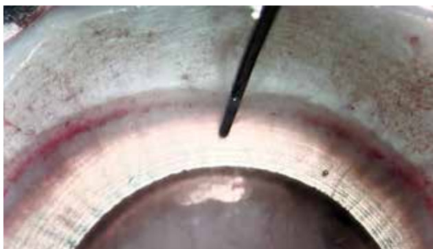
Obrázek 1. Otvor vytvořený pod DM před oddělením pomocí kapalinové bubliny

Zadní lamelární keratoplastika Descemetové membrány s endoteliem (DMEK), kdy je transplantována pouze tenká Descemetová membrána (DM) s vrstvou endotelu se stává stále více populární pro chirurgické řešení Fuchsovy dystrofie a bulózní keratopatie [8] a je u těchto indikací považována za metodu volby. Separace DMEK štěpu je obvykle provedena opatrným seškrábnutím a sloupnutím DM z dárcovské rohovky [1,6]. Tento proces je časově náročný, vyžaduje vysokou zručnost a přináší nemalé riziko protržení membrány [2,8,15]. Nedávno se objevily nové metody, u kterých dochází k oddělení DM pomocí vzduchu/tekutiny injikované mezi DM a rohovkové stroma [9,13,14,16]. Přímé kapalinové oddělení pomocí jehly zasunuté mezi DM a rohovkové stroma je rychlý a jednoduchý způsob, který minimalizuje riziko roztržení membrány [11,16]. Navíc v průběhu oddělení pomocí kapaliny