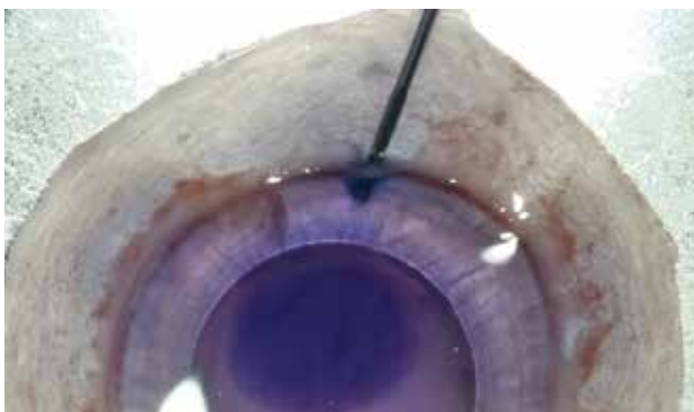
Obrázek 2. Jehla je zavedena do otvoru pod DM tak, aby se oddělila DM od rohovkového stroma a Dua vrstvy