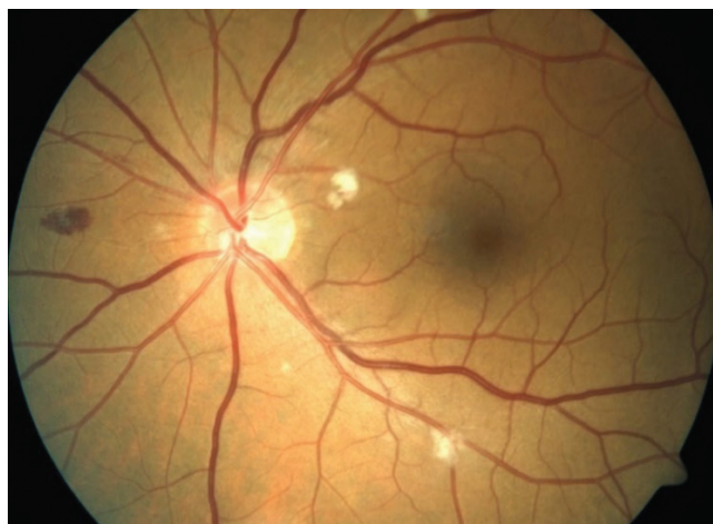
Obrázek 2. HIV mikrovaskulopatie a retinopatie – hemoragie, vatovitá ložiska, drobná mikroaneurysmata