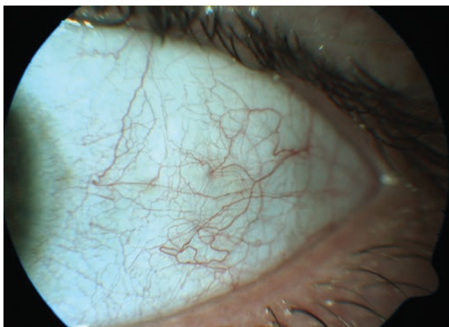
Obrázek 1. HIV mikrovaskulopatie na předním segmentu oka – tortuozita cév, přerušovaný krevní sloupec, mikroaneurysmata

Mikrovaskulopatie je nejčastější oční komplikací HIV infekce. Vyskytuje se až u 70 % pacientů s AIDS a u 40 % HIV infikovaných pacientů [1]. Postihuje přední i zadní segment oka včetně zrkového nervu. Na spojivce bývají patrné tortuozní dilatované cévy s přerušovaným krevním sloupcem a mikroaneurysmata (MA) (obrázek 1). Typickým nálezem na sítnici jsou prchavá vatovitá ložiska, způsobená infarkty ve vrstvě nervových vláken (obrázek 2). Dále na očním pozadí pozorujeme MA, hemoragie a teleangiektázie. Vzácněji se může vyskytnout cystoidní makulární edém. Následkem mikrovaskulární okluze může dojít až k atrofii terče zrkového nervu [1-3,13]. HIV mikrovaskulopatie a retinopatie nejsou však zrak ohrožujícím nálezem. Ve většině případů bývají asymptomatické, zachycené jako náhodný nález při vyšetření očního pozadí.