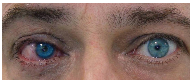
Obrázek 6 a 7. Pac. č. 3 pred a po zákroku KTP