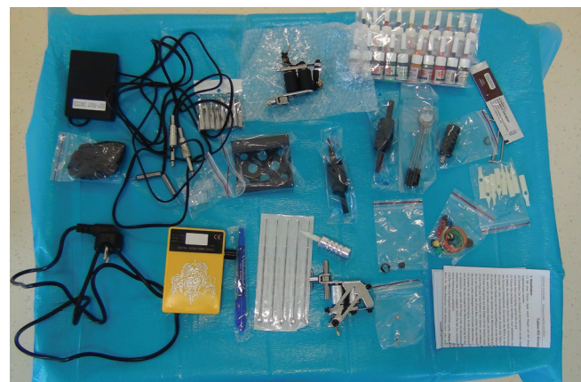
Obrázek 1. Tetovacia sada a pigmenty

Podľa zdravotnej dokumentácie pacient absolvoval niekoľko operácií ľavého oka (vrátane pars plana vitrektómie) v súvislosti s úrazom v minulosti. Objektívne najlepšia korigovaná centrálna zraková ostrosť (NKCZO) pravého oka bola 1,0 a u ľavého oka bola prítomná amauroza. Na rohovke ľavého oka bol sýty leukóm, v centre s náznakom zonulárnych zmien. Prítomný bol tiež divergentný strabizmus (ex anopsia) ľavého oka. Ultrasonografickým B scan vyšetrením sme verifikovali vysokú totálnu inveterovanú amóciu sietnice, vnútroočný tlak bol palpačne nižší – tlak nebolo možné