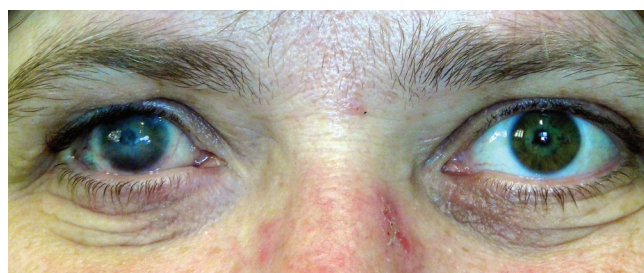
Obrázek 8 a 9. Pac. č. 4 pred a po zákroku KTP