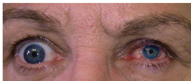
Obrázek 4 a 5. Pac. č. 2 pred a po zákroku KTP