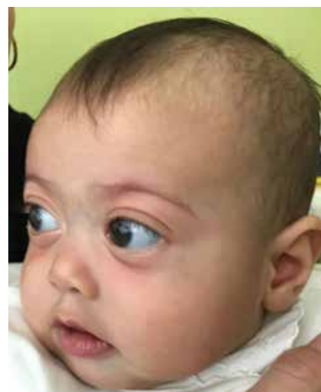
Obr. 2: Dysmorfia strednej časti tváre, plytké orbity, pseudoexoftalmus, hypertelorizmus a nízky koreň nosa u pacientky s Marshall/Sticklerovým syndrómom vo veku 4 mesiacov.