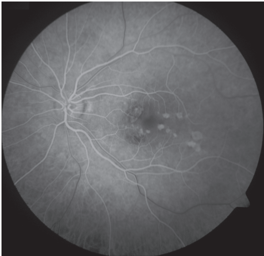
Obr. 3 FAG oka levého. Hyperfluorescence window defektů RPE v místě již neaktivních pozánětlivých lézí