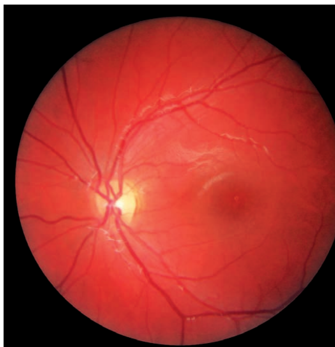
Obr. 1 b) Foto fundu levého oka.