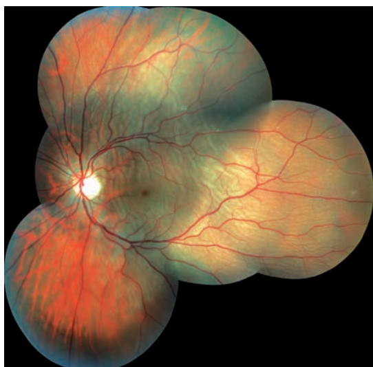
Obr. 1 Kvadrantová amoce zasahující centrální krajinu.

Indicie k provedení operace amoce zevním postupem byly téměř ve všech případech obdobné: mladý pacient s čirou