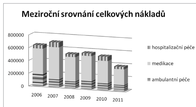
Graf 1. Meziroční tendence celkových nákladů

Zrak je nejdůležitějším lidským smyslem, jeho rozvoj probíhá od narození do