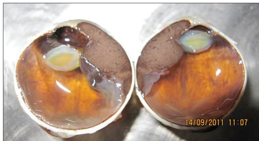
Obr. 1. Malígy melanóm corpus ciliare v štádiu T3N0M0 so sublúxiou šošovky a pre-rastaním do prednej očnej komory

Okrem veľkosti ovplyvňuje prognózu aj tvar nádoru (obr. 1). Za agresívnejšie sa považujú difúzne formy rastu MMU, a v prípade MM dúhovky a corpus ciliare tiež prstencový rast nádoru.