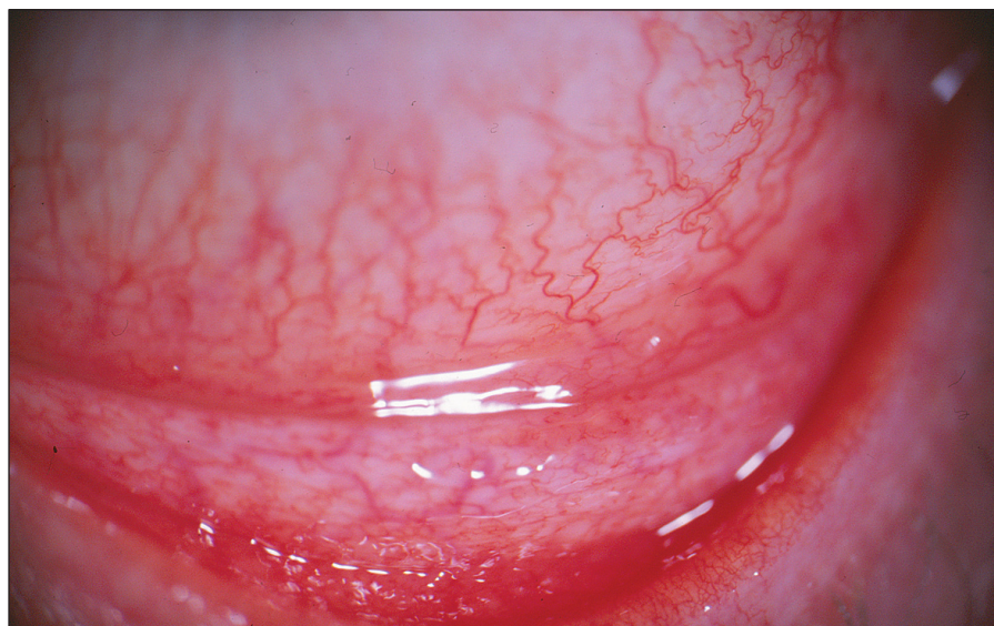
Obr. 3. Pacient č. 5: střední klinický nález – výrazné zduření dolního fornixu s folikuly dolního tarzu doprovázené vinutostí cév bulbární spojivky a hyperémií

O možnosti konjunktivitid etiologie Chlamydia pneumoniae se zmiňuje práce publikovaná před dvaceti pěti lety, ve které autoři referují o folikulární konjunktivitidě bez známek keratitidy [12], ke které patří obraz minimální mukopurulentní sekrece [7]. Chlamydia pneumoniae může dlouhodobě přetrvávat v organismu v makrofázích, které mohou být vektorem jejich šíření v organismu [45]. S variabilními výsledky byla DNA Chlamydia pneumoniae prokázána v periferních leukocytech u pacientů s ICHS [4] a v aterosklerotických plátech [5], kdy se předpokládá společné působení infekčního agens a žírných buněk v produkci cytokinů a matrix degradující metaloproteináz [8]. Pozitivní nález DNA Chlamydia pneumoniae v periferních leukocytech jsme zaznamenali rovněž u dvou našich pacientů s akutní formou folikulární konjunktivitidy a u jednoho nemocného s významně pozitivním sérologickým nálezem svědčícím pro dlouho trvající infekci v možném spojení s Chlamydia trachomatis .