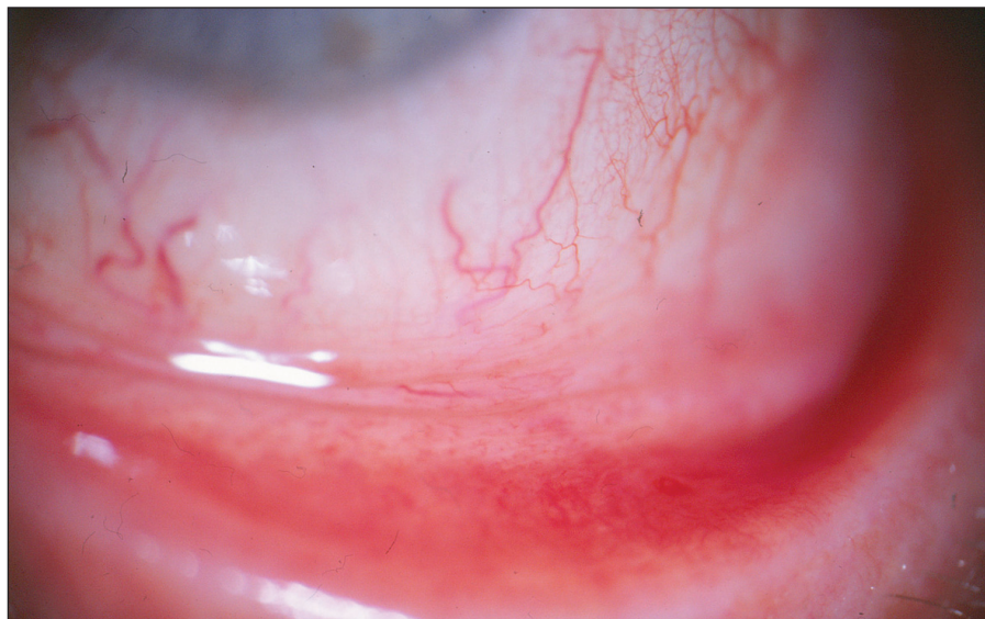
Obr. 1. Pacient č. 9: minimální klinický nále z – náznak hyperémie, vinutosti cév bulbární spojivky a zduření dolního fornixu