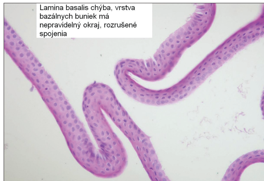
Obr. 2. Epiteliálny flap vytvorený s pomocou alkoholu, lamina basalis nie je prítomná