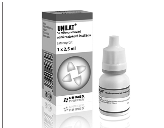
Obr. 1. Generický produkt UNILAT (latanoprost 50 \mu g/ml, očná roztoková instilácia, Unimed Pharma)

Odporúčané dávkovanie bola 1 kvapka do postihnutého oka/očí jedenkrát denne. Viaceré štúdie dokázali, že optimálny účinok sa dosiahne, ak sa latanoprost podáva večer [1, 7]. Odporúčaná doba podávania bola teda medzi 19.–21. hodinou