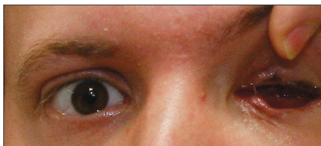
Obr. 3. Posttraumatický anoftalmus vlevo (5. den po úrazu)

Levé oko: porušený dolní slzný kanálek, tržná rána v bulbární spojivce délky 2 cm se zaschlou krustou, bez výrazného krvácení, patrná čtyři místa vbodnutí vidličky na horní mediální straně očníce, posttraumatický anophthalmus, hematoorbita.