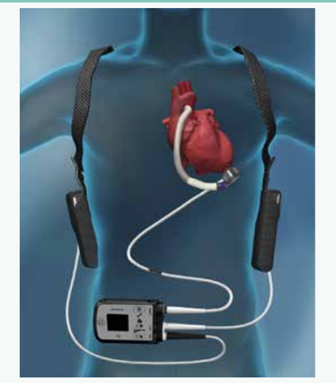
Obr | Mechanická srdeční podpora HeartMate 3