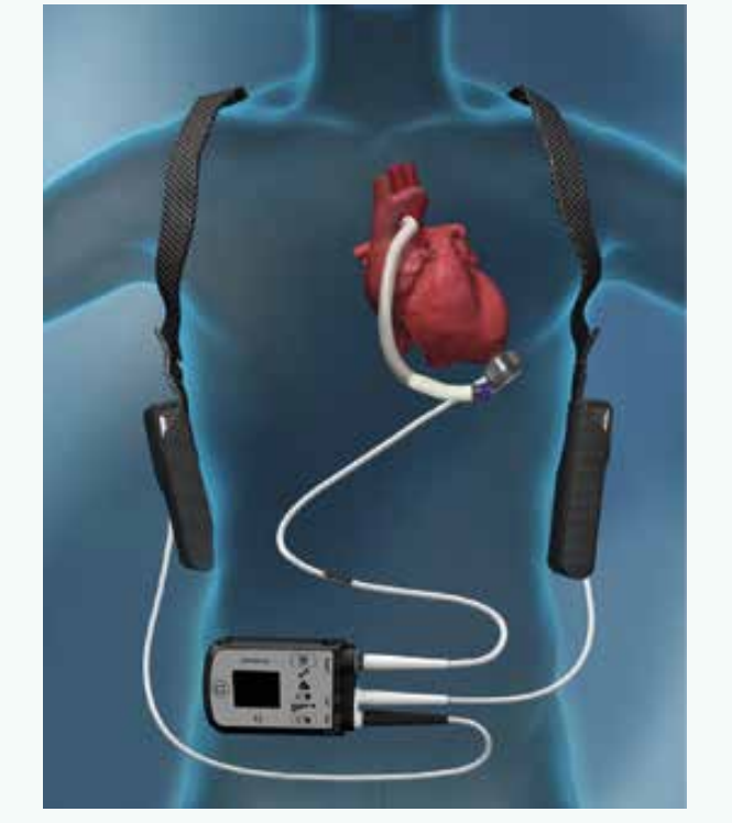
Obr | Mechanická srdeční podpora HeartMate 3 (použito se svolením společnosti Abbott U.S.)